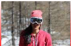
GREY LENS WHITE FRAME