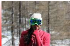
GREEN LENS GREEN FRAME