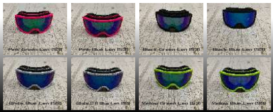
Pink Green Len (S3)