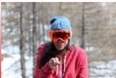
RED LENS RED FRAME